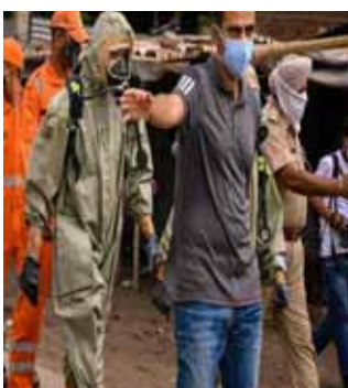
ਇਲਾਕੇ ਵਿੱਚ ਬੀਤੇ ਦਿਨੀਂ ਗੈਸ ਲੀਕ ਹੋਣ ਦੇ ਮਾਮਲੇ ਵਿੱਚ ਐਨਡੀਆਰਐਫ ਅਤੇ ਨਗਰ ਨਿਗਮ ਸਮੇਤ ਸਥਾਨਕ ਪ੍ਰਸ਼ਾਸਨ ਵੱਲੋਂ ਲਗਾਤਾਰ ਗੈਸ ਦੇ ਪੱਧਰ ਦੀ

ਅਤੇ ਹੋਰ ਵਿਭਾਗਾਂ ਦੀ ਟੀਮਾਂ ਵੱਲੋਂ ਜਾਂਚ ਕੀਤੀ ਜਾ ਰਹੀ ਹੈ। ਲੁਧਿਆਣਾ ਦੇ ਗਿਆਸਪੁਰਾ