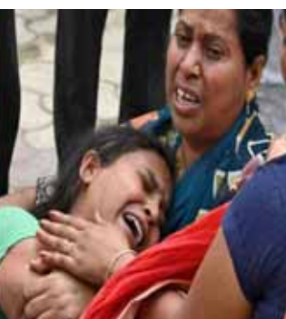
ਹਾਈਡ੍ਰੋਜਨ ਸਲਫਾਈਡ ਗੈਸ ਕਾਰਨ ਵਾਪਰਿਆ। ਹਾਲਾਂਕਿ, ਗੈਸ ਕਿਵੇਂ ਬਣੀ ਇਸ ਦੀ ਜਾਂਚ ਹੋਣੀ ਬਾਕੀ ਹੈ। ਉਨ੍ਹਾਂ ਵੱਲੋਂ ਬੀਤੇ ਰਾਤ ਤੋਂ ਲਗਾਤਾਰ

ਜਾਂਚ ਕੀਤੀ ਜਾ ਰਹੀ ਹੈ। ਪਰ ਹੁਣ ਤੱਕ ਦੀ ਜਾਂਚ ਤੋਂ ਬਾਅਦ ਇਹ ਖੁਲਾਸਾ ਹੋਇਆ ਹੈ। ਇਹ ਹਾਦਸਾ