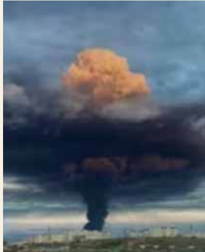
ਗਿਆ ਹੈ। ਇਸ ਤਸਵੀਰ ਵਿੱਚ ਮਾਂ ਕਾਲੀ ਨੂੰ ਹਾਲੀਵੁੱਡ ਅਦਾਕਾਰਾ ਮਰਲਿਨ ਮੁਨਰੋ ਵਾਂਗ ਦਿਖਾਇਆ ਗਿਆ ਹੈ। ਧਮਾਕੇ ਤੋਂ ਨਿਕਲਦੇ

ਪਾਕਿਸਤਾਨ ਨੂੰ ਹਥਿਆਰ ਦੇਣ ਵਾਲੇ ਯੂਕਰੇਨ ਨੇ ਹੁਣ ਅਜਿਹਾ ਕਾਰਾ ਕਰ ਦਿੱਤਾ ਹੈ, ਜਿਸ ਤੋਂ ਬਾਅਦ ਭਾਰਤੀਆਂ ਦਾ ਗੁੱਸਾ ਸੱਤਵੇਂ ਅਸਮਾਨ 'ਤੇ ਹੈ। ਯੂਕਰੇਨ ਦੇ ਰੱਖਿਆ ਮੰਤਰਾਲੇ ਵੱਲੋਂ ਇੱਕ ਤਸਵੀਰ ਟਵੀਟ ਕੀਤੀ ਗਈ ਹੈ, ਜਿਸ ਨੇ ਭਾਰਤੀਆਂ ਖਾਸ ਕਰਕੇ ਹਿੰਦੂਆਂ ਨੂੰ ਨਾਰਾਜ਼ ਕੀਤਾ ਹੈ। ਰੱਖਿਆ ਮੰਤਰਾਲੇ ਦੇ ਅਧਿਕਾਰਤ ਟਵਿੱਟਰ ਹੈਂਡਲ ਤੋਂ ਮਾਂ ਕਾਲੀ ਦੀ ਇੱਕ ਅਪਮਾਨਜਨਕ ਫੋਟੋ ਸਾਂਝੀ ਕੀਤੀ ਗਈ ਹੈ। ਭਾਰਤ ਦੇ ਟਵਿੱਟਰ ਉਪਭੋਗਤਾ ਇਸ ਨੂੰ ਅਪਮਾਨਜਨਕ ਅਤੇ 'ਹਿੰਦੂਫੋਬਿਕ' ਕਰਾਰ ਦੇ ਰਹੇ ਹਨ। ਇਸ ਦੇ ਨਾਲ ਹੀ ਉਹ ਵਿਦੇਸ਼ ਮੰਤਰੀ ਐਸ ਜੈਸ਼ੰਕਰ ਤੋਂ ਇਸ 'ਤੇ ਕਾਰਵਾਈ ਕਰਨ ਦੀ ਮੰਗ ਕਰ ਰਹੇ ਹਨ। ਅਧਿਕਾਰਤ ਟਵਿੱਟਰ ਹੈਂਡਲ @DefenceU ਦੁਆਰਾ 30 ਅਪ੍ਰੈਲ ਨੂੰ ਟਵੀਟ ਕੀਤੀ ਗਈ ਫੋਟੋ ਨੂੰ ਵਰਕ ਆਫ ਆਰਟ ਕੈਪਸ਼ਨ ਨਾਲ ਸਾਂਝਾ ਕੀਤਾ